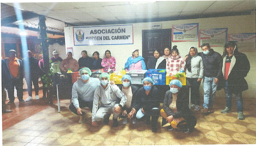
3.- Taller sobre manipulación de alimentos. 25/04/2024